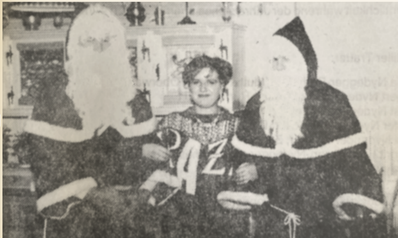
Keine Berührungsängste zu Klaus und Schmutzli bei der Regi-Mitarbeiterin.

Eschlikon, 6. Dezember 1983 – Auch die Regi blieb dieses Jahr vom Samichlaus nicht verschont. Am Betriebsabend kam unverhofft der Nikolaus mit seinem Schmutzli zu Besuch, um der Regi-Belegschaft die «Leviten zu lesen». Nebenbei gesagt und auch wenn's keiner glaubt: Es gab auch ein paar positive Punkte zu vermerken, die Rute wurde nur spärlich eingesetzt und am Schluss durften gar alle ein hübsches Chlaussäckli in Empfang nehmen.