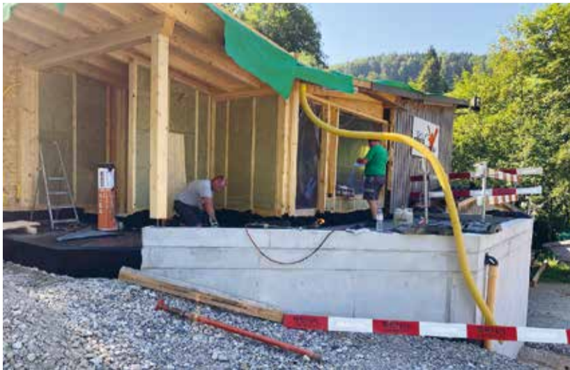
Die Arbeiten am Arosa Stübli gingen dank vieler Helferinnen und Helfer flott voran.

Aufgrund der Wetterprognose haben wir entschieden, das Kinderland und den Ponylift zu beschneien. Ab dem 25. Januar konnten wir dann die Skischule und den Ponylift für unsere Gäste bereitstellen. Während drei Tagen konnten wir so Skischule anbieten und 120 Lektionen Skiuunterricht für unsere Kleinsten erteilen. Die Ponylift-Saison war dann am 2. Februar leider auch schon wieder zu Ende. Seit längerer Zeit machte sich die Verwaltung Gedanken über den Pistenbully 300. Für die momentanen Schneeverhältnisse ist diese Maschine einfach zu gross, der Einsatz bei wenig Schnee und kein gefrorener Boden hinterlässt jeweils grosse Landschaften. Am 26. Januar konnten wir einen