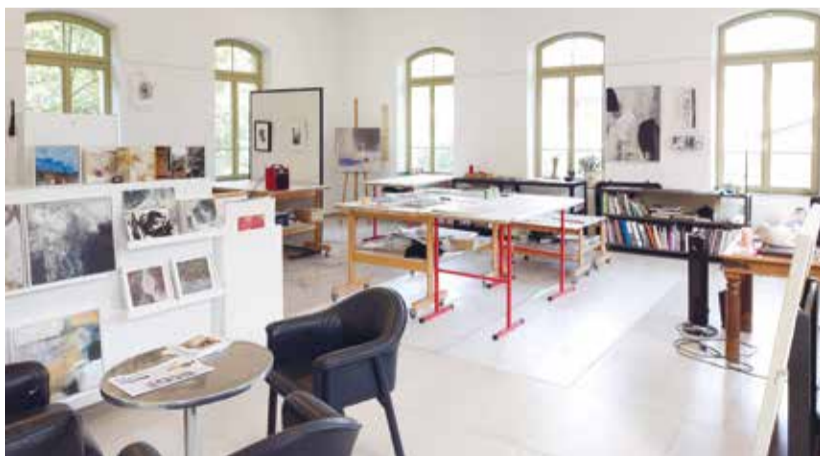
Kommen Sie vorbei und sehen Sie sich um im offenen Advents-Atelier.