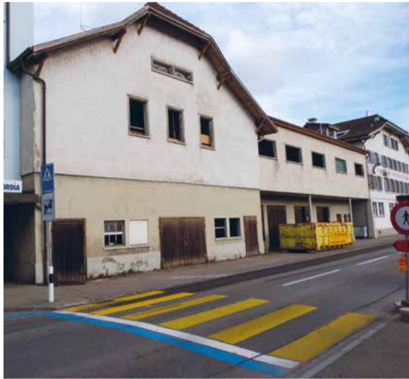
Ein Knacknuss war die Wand zwischen Lindensaal und dem einstigen Migrosgebäude.

Gleichzeitig sind auch Bagger auf der Nordseite der Bahnhofstrasse aufgeföhren, wo vom ehemaligen Lindensaal nur noch die Grundmauern sowie das Dach stehen und leere Fensterlöcher aus den Wänden gähnen. Eine Vorsatzwand zum einstigen Migrosgebäude auf der Westseite wurde bereits betonierte und auch eine neue Wand auf der Ostseite erstellt. Fussgänger und Verkehrsteilnehmende haben in diesen Tagen unliebsame Einschränkungen auf sich nehmen müssen.