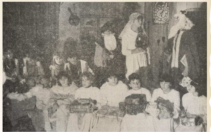
Besuch im Wolkenschloss des alten Königs Winter.