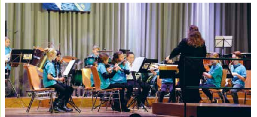
Der Nachwuchs musiziert bisweilen noch in der Jugendmusik Tannzapfenland. Bestimmt wird man den Einen oder Anderen schon bald bei den «Grossen» sehen.