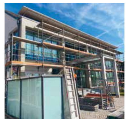
Gemeindehaus während Sanierung

auch ungeschulten Personen ermöglicht, die Elektroden des Gerätes am Körper der hilfebedürftigen Person anzulegen. Darüber hinaus gibt das Gerät per Lautsprecher eine Anleitung. In den Büroräumlichkeiten des Bauamtes und der Technischen Werke sowie im Sitzungszimmer wurden Klimageräte installiert. Diese werden vor allem in den Sommermonaten die Raumtemperaturen auf einen angenehmen Wert reduzieren.