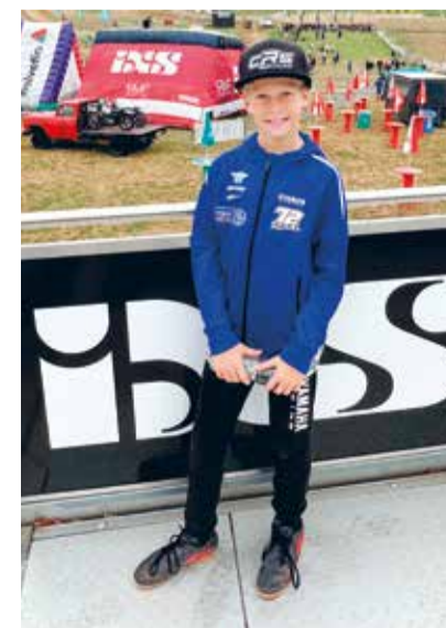
Er gehört zu den grössten nationalen Nachwuchstalente im Motocrosssport.