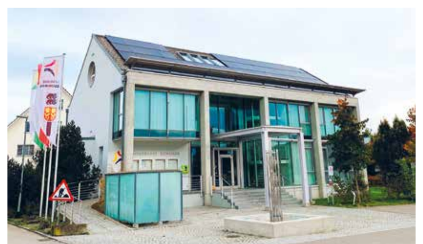
Gemeindehaus nach Sanierung