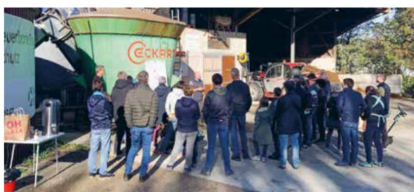
Die Biogasanlage rief und die Interessierten kamen in Scharen.