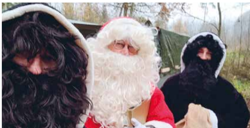
Die Samichläuse freuen sich auf viele Besucher.