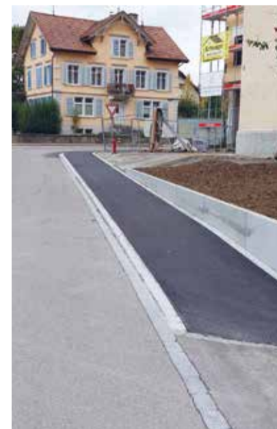
Fertiges Trottoir an der Wiesenstrasse Eschlikon.

Zeitgleich mit dem Bau eines neuen Mehrfamilienhauses an der Wiesenstrasse 1a, Eschlikon (neben dem Gemeindehaus) konnte die Gemeinde im unübersichtlichen und schmalen Bereich Verzweigung Bahnhofstrasse/Wiesenstrasse ein Trottoir erstellen. Der Grundstücksbesitzer der neuen Liegenschaft hat dazu Hand geboten und es konnte ein Dienstbarkeitsvertrag abgeschlossen werden. Das heisst, das benötigte Land wurde nicht gekauft, sondern vom Besitzer zur Nutzung zur Verfügung gestellt. Das neue Trottoir trägt zur Erhöhung der Sicherheit für alle bei, muss doch so in einem engen Bereich nicht mehr auf der Strasse gelaufen werden. Die Erstellung war im Budget 2023 und konnte abgeschlossen werden.