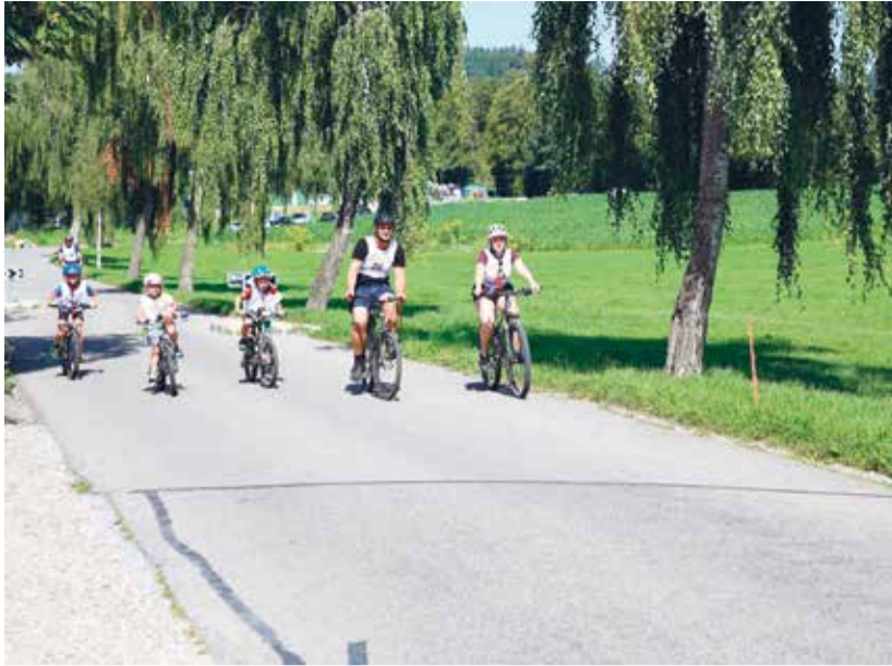
Die Hinterthurgauer 2-Stunden-Fahrt brachte wiederum viel Geld ein für einen guten Zweck.