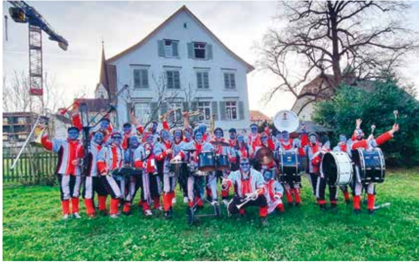
Die Tannzapfäschüttler freuen sich auf die bevorstehenden Auftritte.