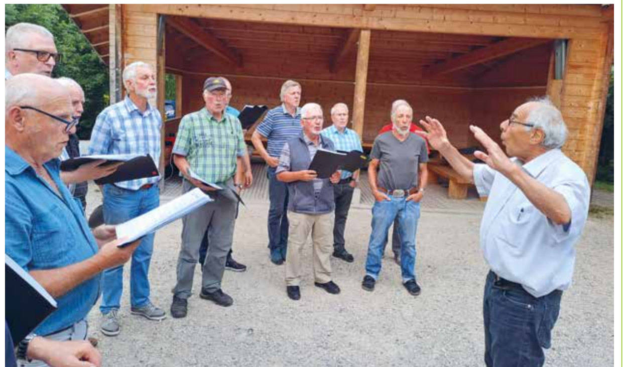
Der Männerchor Eschlikon freut sich auf viele Besucher an den Probeabenden ab dem 15. August.