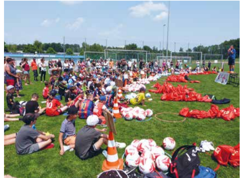
Die muntere Schar bei der Begrüssung am Montagmittag.