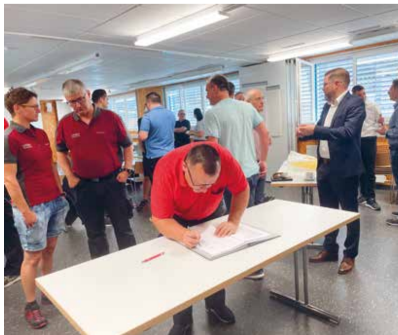
Mit ihrer Unterschrift besiegeln die Verantwortlichen die zukünftige Zusammenarbeit.