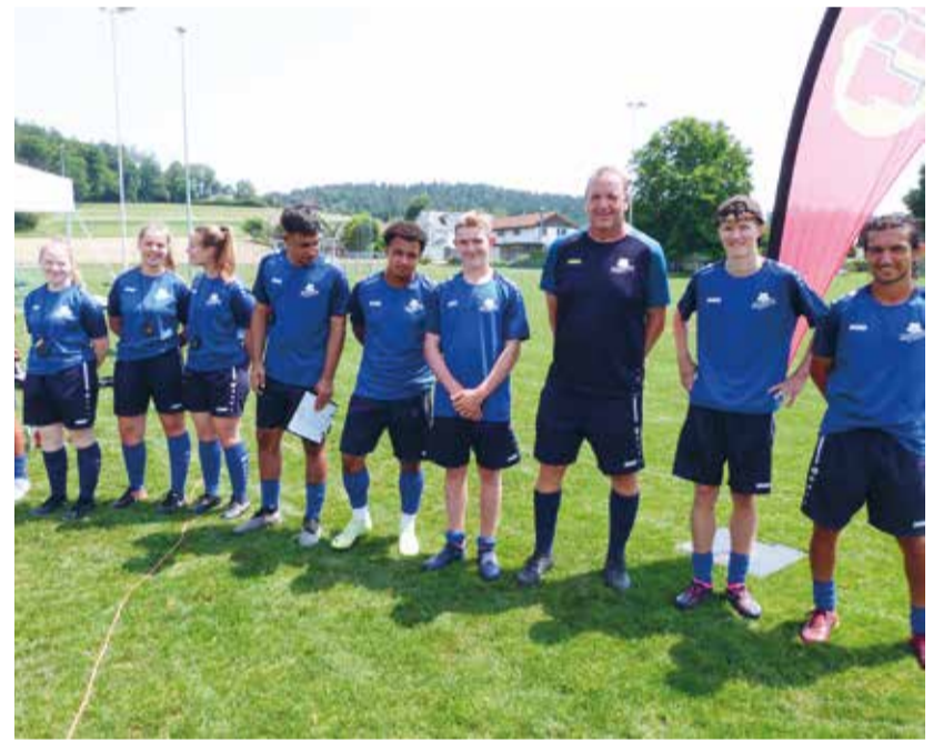
Die Trainer und Trainerinnen wurden einzeln vorgestellt.