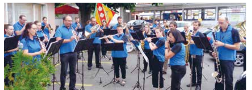
Das vielseitige Konzertprogramm gefiel den Gästen beim Restaurant Bahnhof in Sirmach.