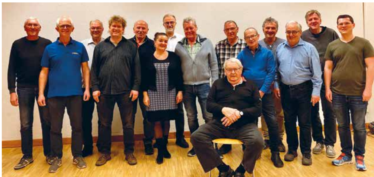
Engagierte Projektsänger für das Winzerfest im September sind beim Männerchor Ettenhausen herzlich willkommen.

Der Männerchor Ettenhausen hat eine lange Tradition. Der 1907 von neun initiativen Bürgern gegründete Dorfverein passte sein grosses Liederrepertoire und die Vereinsaktivitäten ständig dem Wandel der Zeit an. Auch wenn die Mitgliederzahl heute