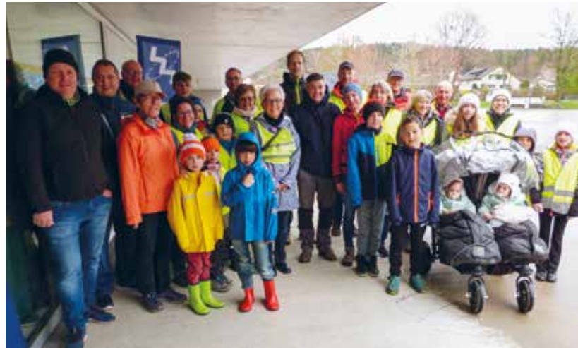
Einsatzwillige Dorfbewohner blenden das Vermüllen nicht aus.

Was fast wie ein Spiel anmutete, wurde zu bitterem Ernst: Verpackungen von Lebensmitteln, Getränkedosen Plastik, Bananenschalen, Zigarettenstummeln, Kugelschreiber, Papier, Gummiteile, Bier- und Parfümflaschen sowie allerlei Hausmüll wurden zur unliebsamen Begierde der Sammlerinnen und Sammler.