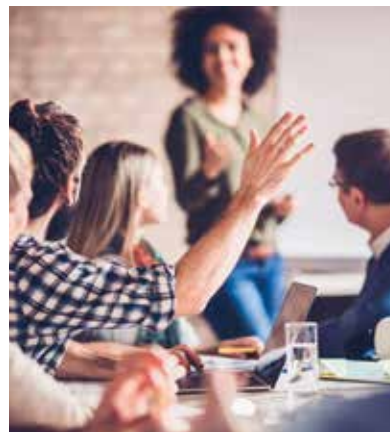
Die Workshops richten sich an Vereinsmitglieder, die ihren Verein weiterbringen wollen.

Das «Einmaleins» des zukunftsorientierten, modernen Vereinsmanagements kompakt verpackt: das ist die «Vereinschmiede» des Kantons Thurgau. Die Impuls-Workshops werden seit 2019 in Zusammenarbeit mit dem Departement für Erziehung und Kultur und benevol Thurgau angeboten. Die Themen werden jährlich den Bedürfnissen der Zielgruppe angepasst und dienen als Grundlage für ein modernes Vereinsmanagement. Thematisiert werden aktuelle Herausforderungen für Vereinsvorstände.