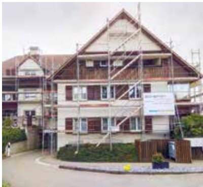
Bei einem Mehrfamilienhaus in Müllheim wurden das Mauerwerk frisch verputzt und das Holzwerk geschliffen und gestrichen.

Bevor die Fachleute des Unternehmens am Objekt jedoch Hand anlegen, findet eine umfassende fachliche Beratung statt. Was ist nötig? Was sinnvoll? Wann ist der richtige Zeitpunkt? Und braucht es Bewilligungen? Gemeinsam mit der Kundschaft entscheiden sie, ob Reinigen und Anstreichen reichen. Einzigartig ist dabei das Konzept der drei Farb-Grundangebote. In der Linie «Premium» werden ausschliesslich die derzeit besten Produkte und Verfahren eingesetzt. «Economy» ist ebenfalls einwandfreie Qualität, jedoch mit stärkerem Fokus auf die finanzielle