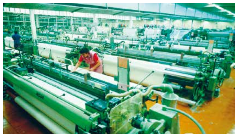
Blick in den Websaal der Weberei Wängi um 1980.

Region – Dank einer neuartigen Maschine gelang es der Weberei Wängi, Saristoffe zu weben. Und auch in der Herstellung von Daunendichtgeweben zählten sie damals zur weltweiten Nummer eins. Die Weberinnen in Wängi mussten technisch versiert sein, sie wechselten ständig zwischen den Maschinen hin und her und kontrollierten den Webverlauf. Kam es zu Fadenbrüchen und Schiffschlängen, waren ihre geschickten Hände gefragt. Der Kampf um bessere Arbeitsbedingungen zog sich wie ein roter Faden durch die Firmengeschichte. Die Weberinnen verdienten nicht nur wenig, sondern litten auch unter den Folgen von Schichtarbeit, stickiger Luft und infernalischem Lärm in