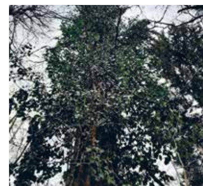
Efeu ist für die Bäume nicht schädlich und zugleich Lebensraum für Kleintiere und Vögel.