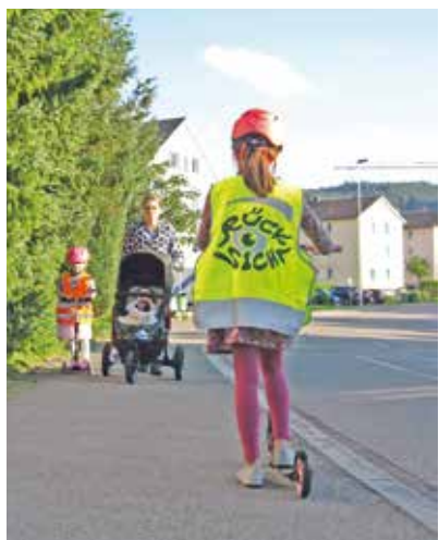
Das Sujet der vergangenen Leuchtwestenaktion lautete «Rücksicht».