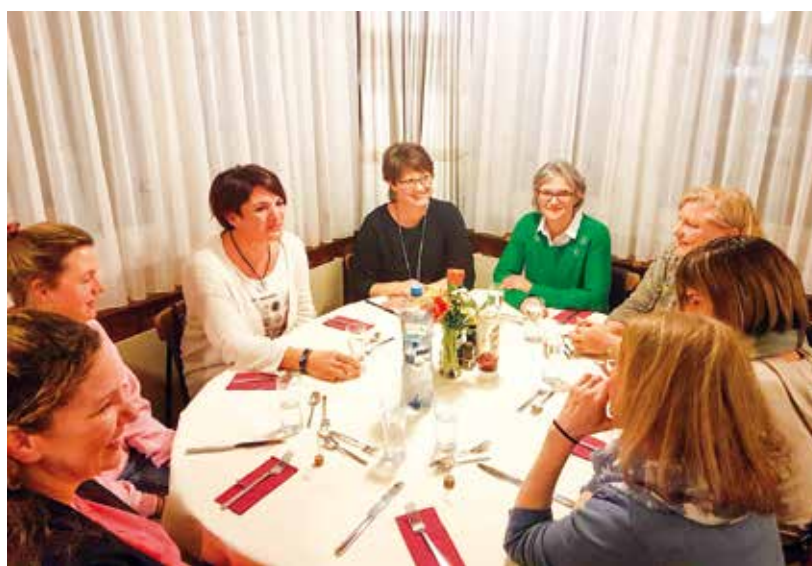
Ein gelungener Abend bei der Jahresversammlung des Landfrauenvereins Bettwiesen.