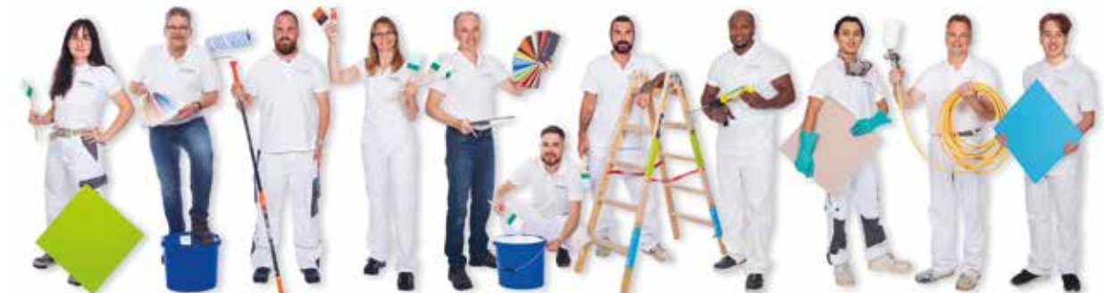
Die Kundschaft profitiert von der Fachkompetenz und dem beruflichen Engagement des Teams von Schefer+Partner AG.

Schefer+Partner AG Die Farbgeber Heidelbergstrasse 9, 8355 Aadorf Telefon 052 365 24 24 Fax 052 365 24 22 office@schefer-partner.ch www.schefer-partner.ch