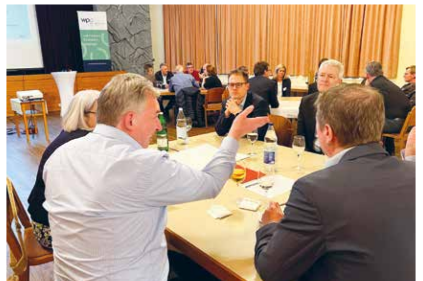
Das Verbesserungspotenzial in der Berufsfindung wurde erfolgreich diskutiert.

Die Teilnehmenden waren sich einig, dass im Bereich der Berufserkundung noch Potenzial schlummert. In einem Video kamen zunächst Jugendliche selbst zu Wort, daraufhin folgten Interviews mit Exponenten aus den Institutionen Berufsberatung, Schulleitung und Wirtschaft. Zum Schluss diskutierten die Anwesenden, wer welche Rolle übernehmen könnte. Eine Mehrheit plädierte dafür, dass