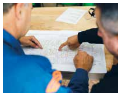
Für neutrale Energieberatung steht in den Gemeinden Aadorf, Eschlikon, Münchwilen, Sirnach und Wängi die Thurgie Energieberatung zur Verfügung.

Ob sich ein Hauseigentümer in diesem Winter überlegt, die fossile Heizung durch ein System mit erneuerbaren Energien zu ersetzen, sich mit dem Gedanken trägt, die Sonnenenergie zu nutzen oder ein Gewerbetreibender seine Liegenschaft sanieren will: Am Anfang jedes Bauprojekts steht die Energieberatung.