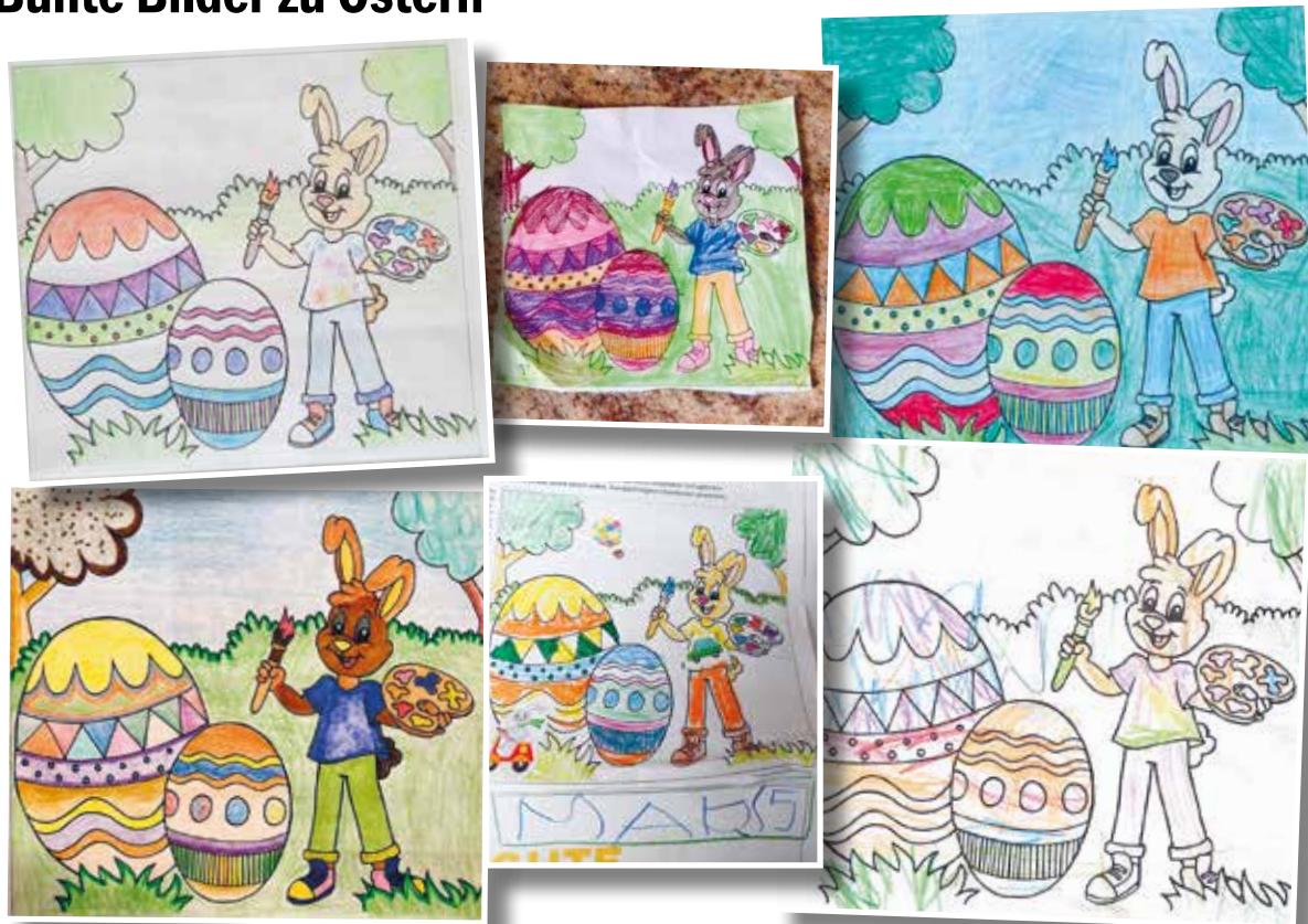
Ostern zählt zu den wichtigsten Festtagen für Christen, da die Auferstehung Jesu am Ostersonntag zelebriert wird. Passend zu diesem erfreulichen Fest sind auch die zahlreichen bunten Osterbilder, die im Rahmen des Oster-Malwettbewerbs eingegangen sind. Abgebildet ist eine Bildauswahl von jungen Künstler und Künstlerinnen der Region, die ihrer Kreativität freien Lauf gelassen haben.