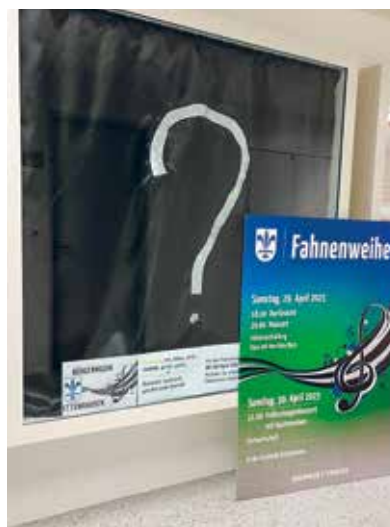
Bald wird die neue Vereinsfahne enthüllt.

Ettenhausen – Nach den Beschlüssen des Vereins im Jahr 2019 wurde eine neue Vereinsfahne kreiert und in Zusammenarbeit mit der Heimgartner Fahnen AG in Wil produziert. Nach ihrem Transfer im August 2020 nach Ettenhausen, blieb sie hinter der schwarzen Verhüllung am geheimen Ort versteckt. Die Fahnenweihe wird mit einem Dorfznacht eröffnet, der aus Zehndi's Küche stammt. Er beginnt um 18 Uhr. Mit einem Festakt und Konzert wird der neue Vereinsstolz am Abend des 29. April enthüllt. Umrahmt von einem tollen, flaggigen Konzert des Vereins, welcher mit Musikantinnen und Musikanten aus Thurtal-Hüttlingen verstärkt wird. Auch die Ehrung zum CISM-Veteran